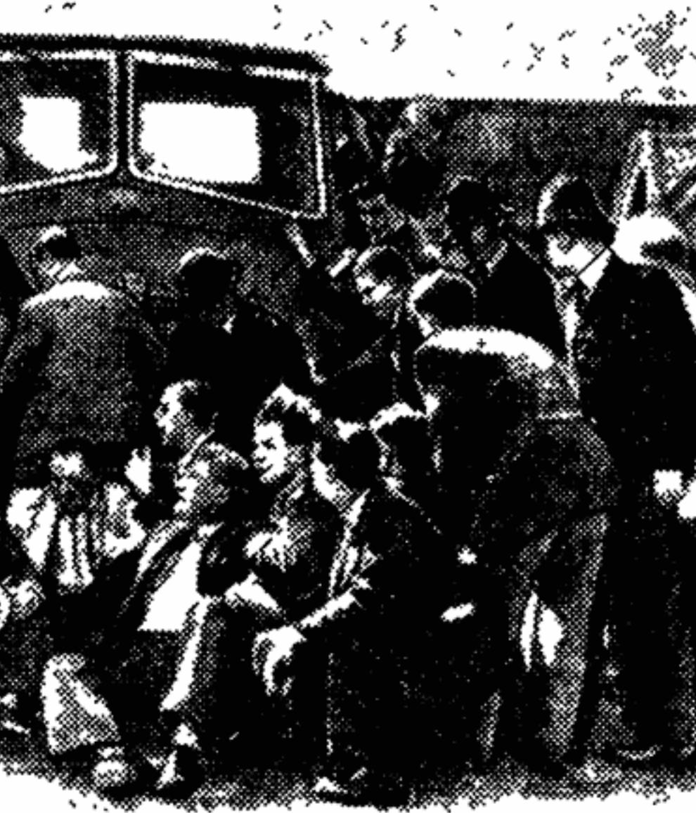
У ворот завода «Остин» в Бирмингеме (Англия). Пикет бастующих рабочих завода не пропускает грузовик, изготовленный на их предприятии.