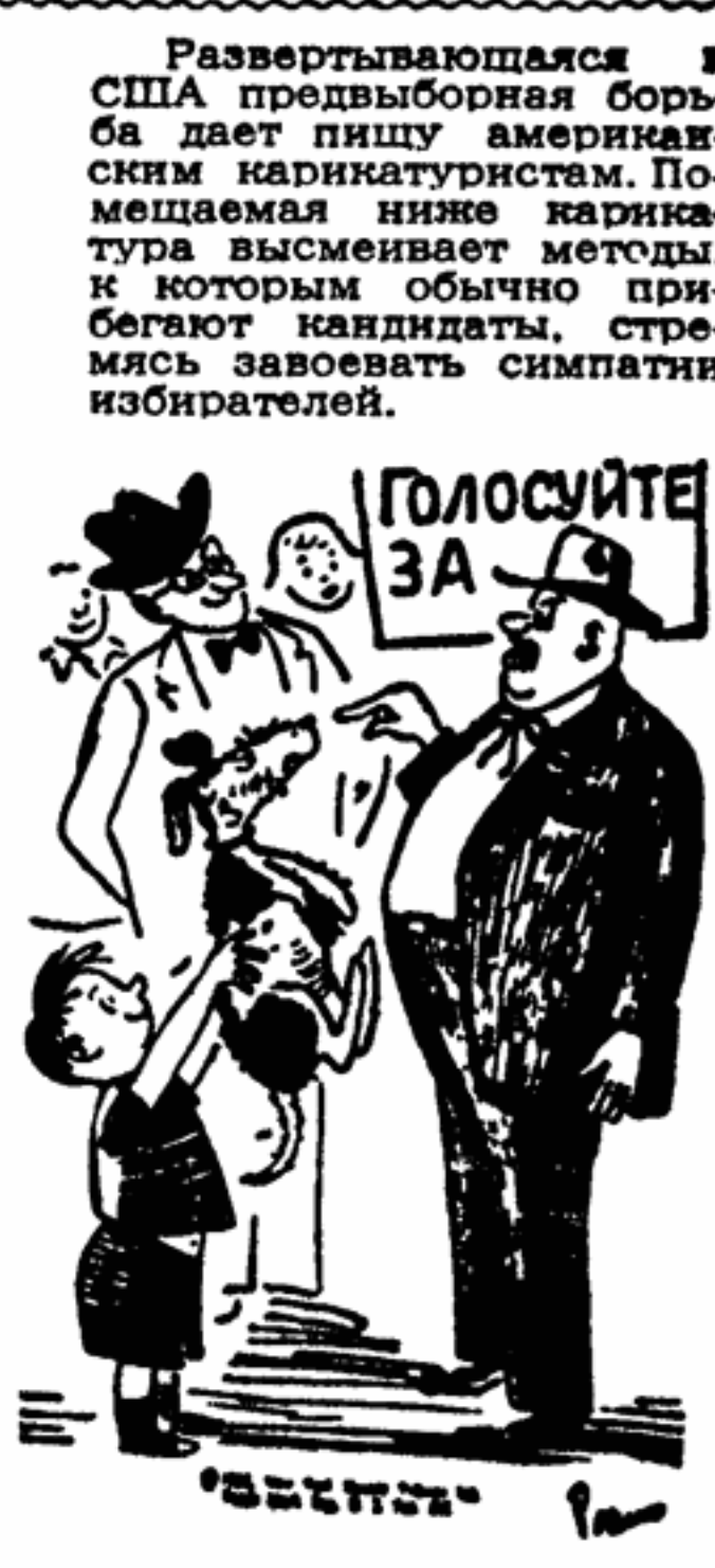
Развертывающаяся в США предвыборная борьба дает пищу американским карикатуристам. Помощая ниже карикатура высмеивает методы, к которым обычно прибегают кандидаты, стремясь завоевать симпатии избирателей.

Филипп БОЛСОВЕР, английский журналист ЛОНДОН, 10 августа. (По телеграфу)