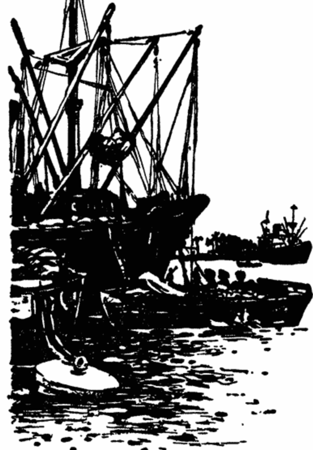
В гавани Порт-Саид